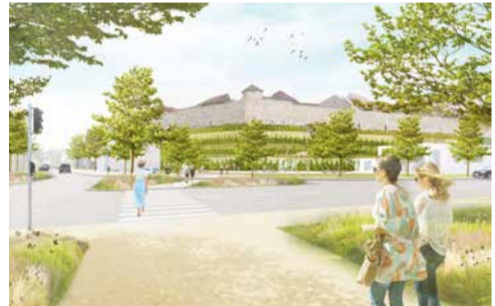
Ringgarten Altstadt – das ehemalige Ensemble Weinberg und Altstadt wird revitalisiert