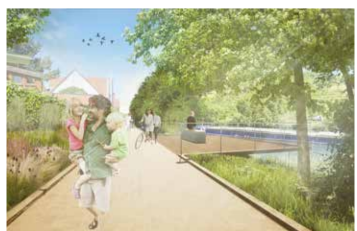
Promenade mit Sitzmöglichkeiten und Aussichtsbalkonen am Benninger Ufer