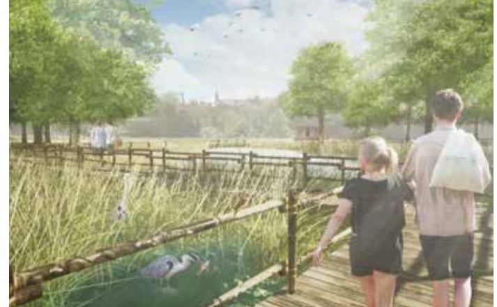
Naturbeobachtungsbereiche in der Benninger Auenlandschaft