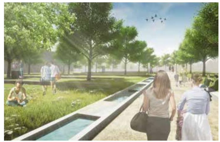
Neuer Literaturpark auf der Schillerhöhe